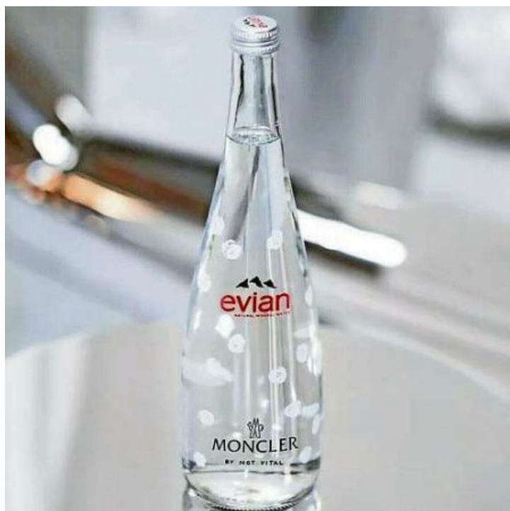
Evian X Moncler ediziun limitada da Not Vital – Quai tuna bain bain e va giu sco aua.

Tgi che ha propi propi interess dad in da quests regalins, l'autur trametta gugent ils links! Pitschen tip: Endatai ina giada «Rumantsch» sin plattafurmas d'aucziun sco www.ebay.com . Là chattais ulteriura rauba magari interessanta per Rumantschunas e Rumantschuns. Bellas Festas!