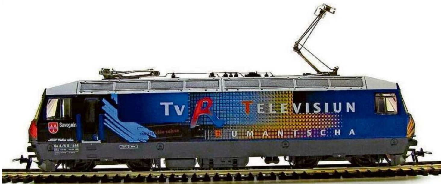
Il trenin da model da la Viafier Retica per collecziunaders paschiunads, go for it.